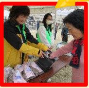
～ゴール！お楽しみ抽選会♪～